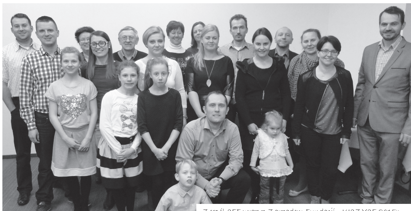
Zespół CEF wraz z Zarządem Fundacji - KICZYCE 2015r.

Ufamy, że nowe pokolenie pracowników CEF w Polsce wykrzysta szansę ewangelizowania polskich dzieci w nadchodzących latach. Pozostajemy za nimi w modlitwach.