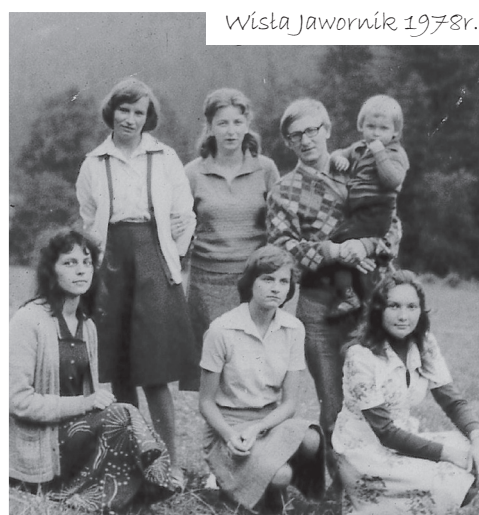
Wiśla Jawornik 1978r.

O rganizowanie żywności na kursy szkoleniowe i obozy ewangelizacyjne było dodatkowym zajęciem. Trzeba było stać w długich kolejkach: po 1 kg mięsa trzeba było stać czasem pięć, a nawet więcej godzin.