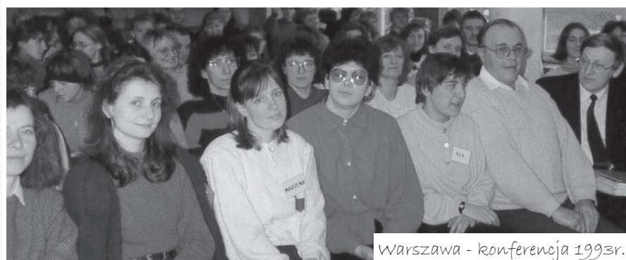
Warszawa - konferencja 1993r.