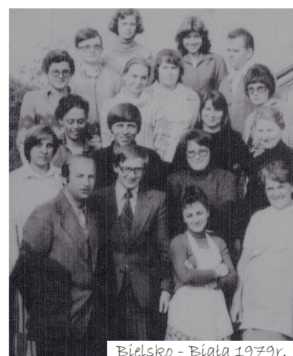
Bielsko - Biała 1979r.