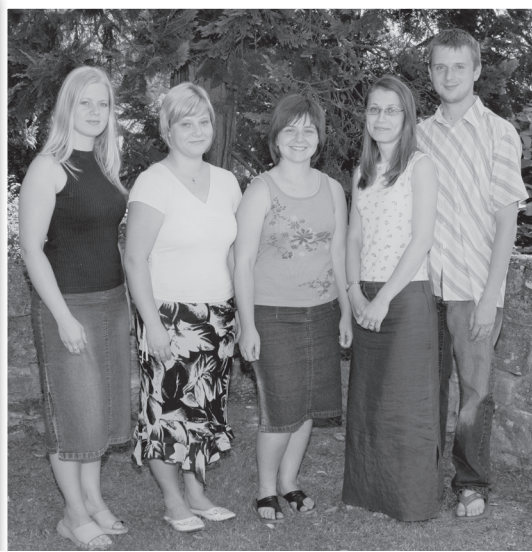
Instytut szkoleniowy Kilchzimmer 2006r.