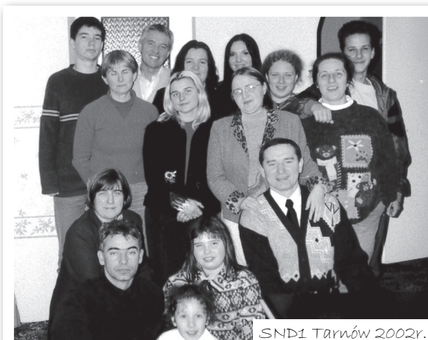
SND1 Tarnów 2002r.